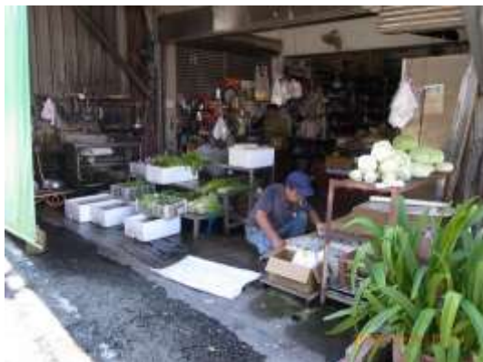
大埔街上固定的蔬菜攤