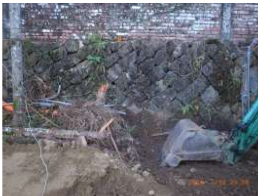
大埔中小學圍牆下方先用砌石鞏固土方

上圖中的屋舍約建於民國 50 年代，目前仍保留著。可以看出地基是砌石，屋內填土。結構下半部為麻竹管，上半部包括屋頂、屋簷的支柱為杉木或紅檜。牆壁為竹篾編成，外面在塗上石灰。屋前還擺放大埔常用的竹籬、扁擔，還有剉番薯籤的機器。屋頂為桂竹管剖半，交錯疊放。