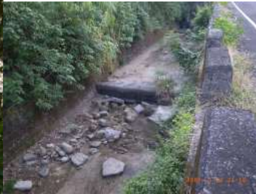
以混凝土工法整治後的溪流

我本人則在 2021 年上去做田野時，目睹湖濱公園的露營區全部被淹沒，水一直淹到湖濱公園大門。聽當地人說，最高時淹到農情館一帶。