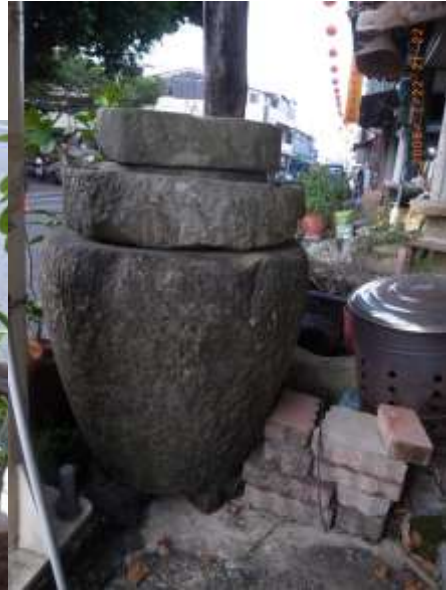
昔日的石磨退隱 放置屋前做為擺設