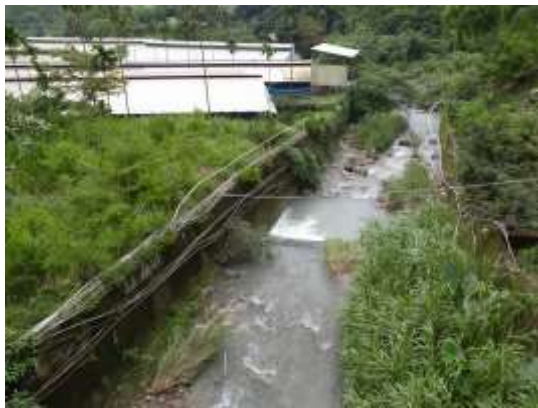
現代水笕以塑膠管取代

種水稻都是六月開始佈田，12 月收成。後來則是重陽後就有人開始割稻。晚冬稻子收成後，有些會人會種些小季，如青皮仔豆。