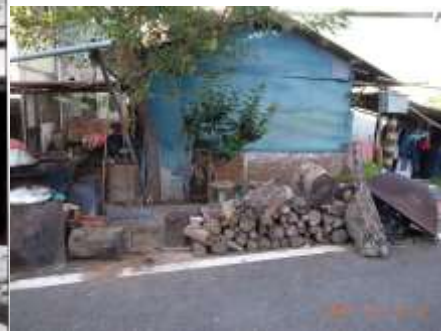
山區居民常見將樹枝當作薪材 整齊排放