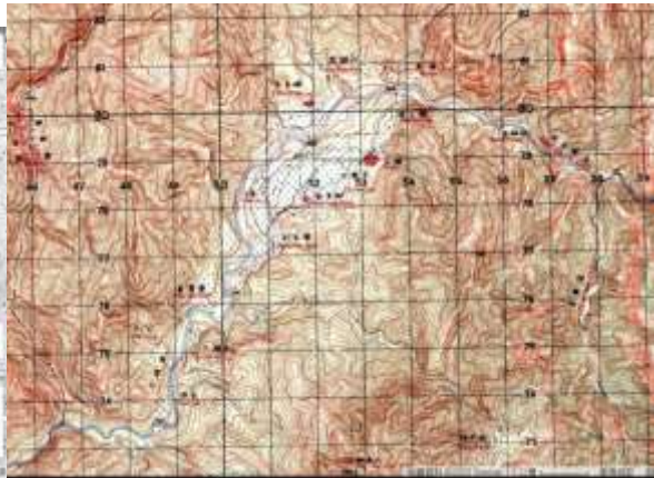
1956 五萬分之一台灣地形圖