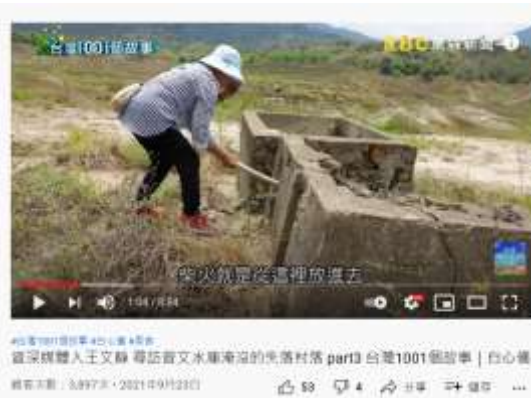
2021 年逢乾旱，水庫淹沒的老聚落廚房出土 東森新聞報導