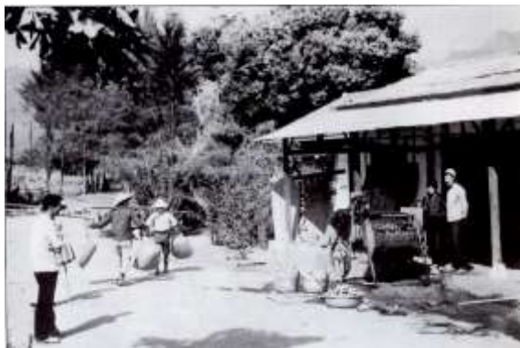
茄苳腳路 2016年 戀戀大埔