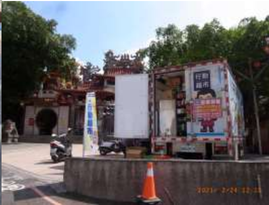
北極殿前有菜販固定每周 2-3 天上來 全聯的行動超市