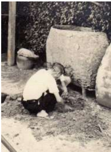
笊池 約民國 50 年代 溪口鄉曾肇欣提供

值得留意還有左圖屋前右方有一個竹篾編成的器物，稱為 笊池 ，用來貯放稻穀或番薯籤。