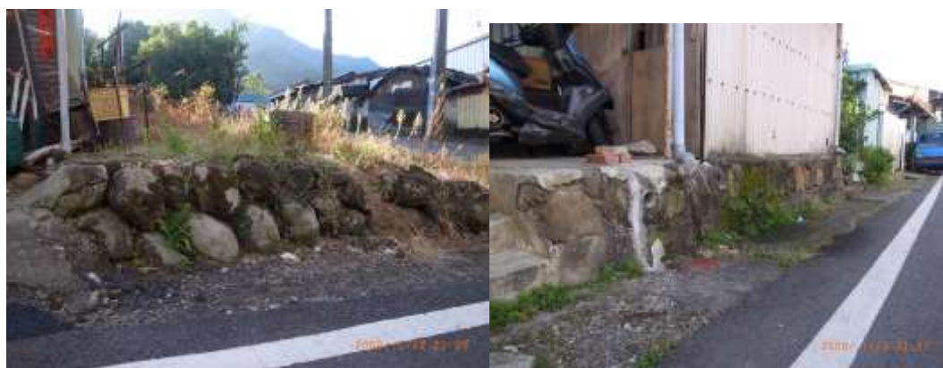
砌石固定土方 大茅埔