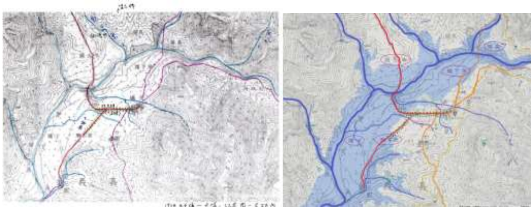
凍仔腳路 牛舌埔--大埔部分 底圖 1924

大埔為鄰近山區的山產集散地，大埔老街過去最熱鬧的地方稱為 十字路 或 雙叉路 。下 2 圖中，朱紅色線條