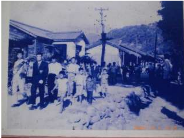
民國 50 年代結婚的情景 照片正中偏左的建物

1944(民 33)年改組為：大埔庄農業會。 民國 36 年改組為：大埔鄉合作社。 民國 38 年再改為大埔鄉農會。