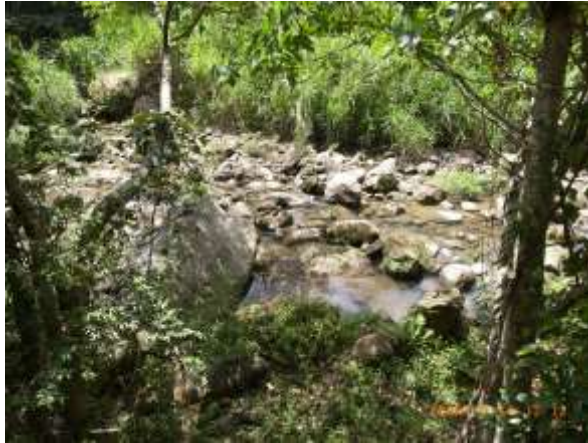
長枝坑溪保留未整治的原貌