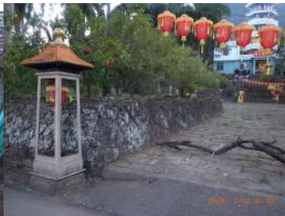
七寶塔的砌石圍牆

下二圖為大埔老街上的一棟舊房子，可見到最底下有石條，牆壁下堵也是石條，杉木結構、竹篾編牆，外壁塗上石灰。