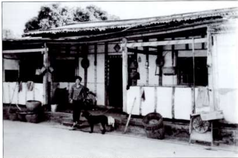
▲家園、村姑、忠實的小狗、古農具組成「田園交響曲」