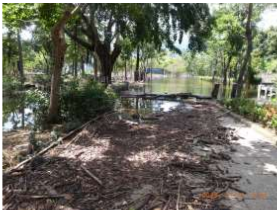
大埔湖濱公園淹大水 20210923，露營區全被淹沒

我本人則在 2021 年上去做田野時，目睹湖濱公園的露營區全部被淹沒，水一直淹到湖濱公園大門。聽當地人說，最高時淹到農情館一帶。