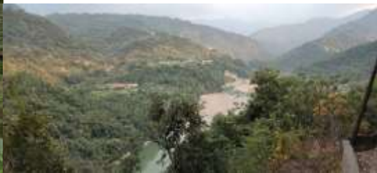
從通往茶山的產業道路眺望內葉翅民居

水源--牛舌埔圳 溪頭從分水嶺通下來，截 匏仔寮溪 ，從內灣子-圳頭-匏仔寮溪下來，圳頭距牛舌埔約半公里。