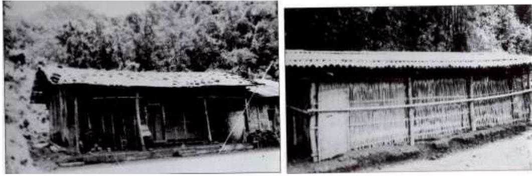
竹管子厝 戀戀大埔

上面兩張照片即為大埔常見的竹管子厝，屋頂皆為桂竹剖半疊放，左圖屋頂上放磚塊壓住，右圖的桂竹屋頂上還加上竹條來固定。