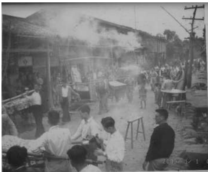
約為民國 50 年代結婚的情景 背景可以看出當時大埔街的景況。