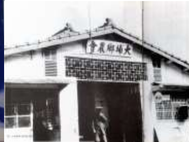
為日治時期所建的農會。