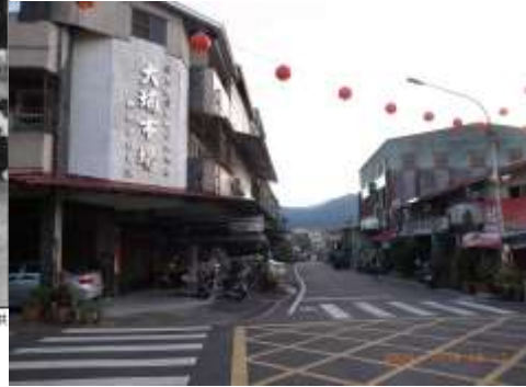
大埔國小舊址位於現今大埔市場後方