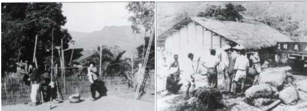
大埔民宅之庭院、曬衣竹竿、竹圍牆