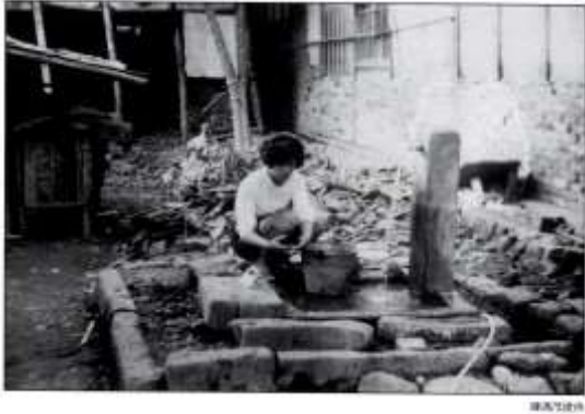
簡易自來水 民國五十、六十年代

民國 43 年，創設大埔給水站，由嘉義縣自來水廠經營。大埔給水站併入台灣省自來水公司第五區管理處。